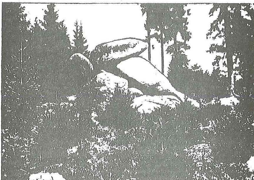
Die sagenumwobenen Dreibrodesteine

So endete die alte Erzählerin die Geschichte. Die Gesellschaft wünschte sich gute Nacht und Jeder ging nachdenkend seiner Hütte zu.