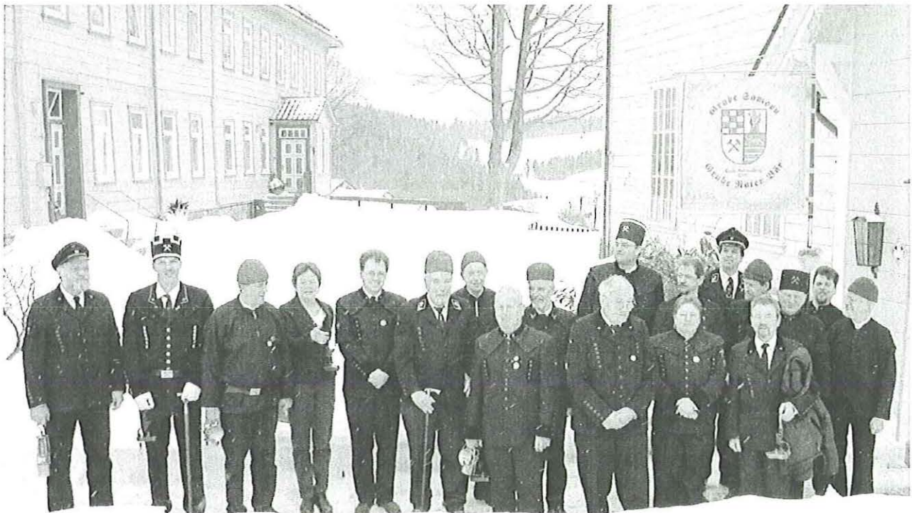
Teilnehmer von links nach rechts