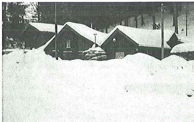
Schnee am Bären. März 2006